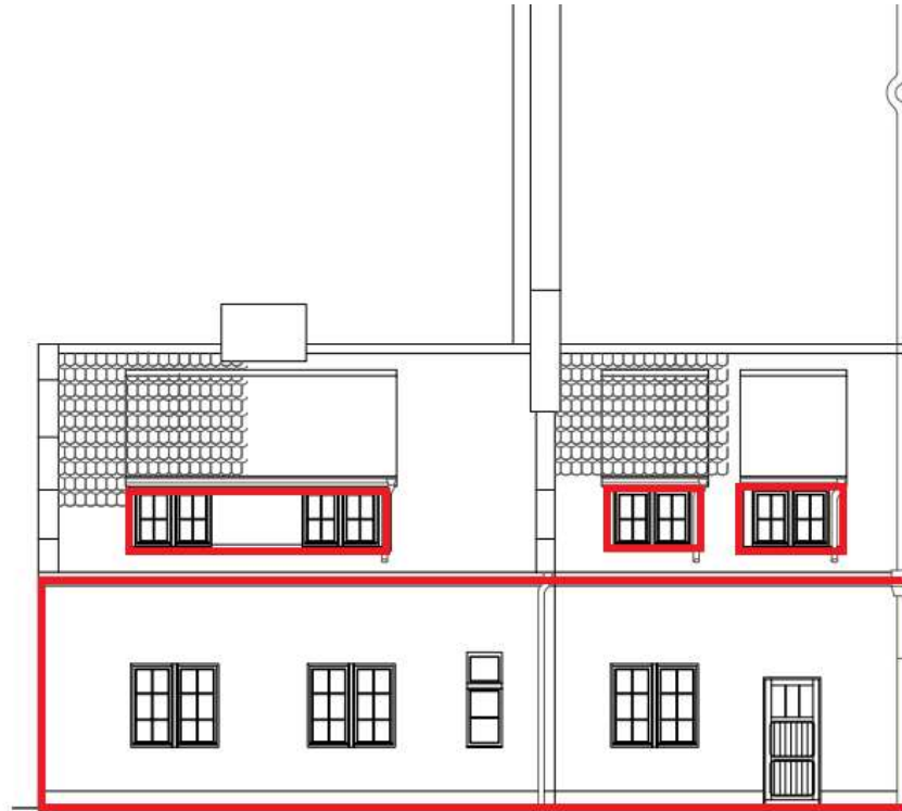
ELEWACJA PÓŁNOCNA DOMKU WOŹNEGO OD STRONY DZIEDZIŃCA